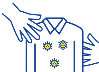
Via delen van linnengoed, kledij, vaatwerk ...