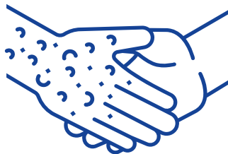
Contact met de puistjes