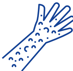
Versijnen van puistjes

BIJ SOMMIGE PERSONEN DOEN ZICH OOK DE VOLGENDE SYMPTOMEN VOOR