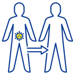
Contact tijdens de geslachtsgemeenschap

Patiënten in België liepen het virus vooral op door seksueel contact tussen mannen (91%). Het zou echter fout zijn om het apenpokkenvirus te beschouwen als een ziekte die alleen de homogemeenschap kan treffen. Seksueel contact is in de huidige context wel de belangrijkste besmettingsbron. Het risico op infectie neemt toe bij een groot aantal partners.