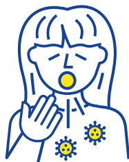
Via afscheiding uit de luchtwegen